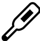
発熱等の症状がある場合 ご参加をお控えください