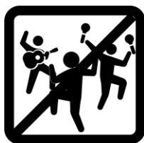
大規模イベントの 自粛