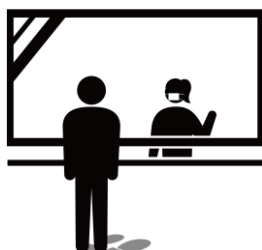
飛散防止フィルムの設置